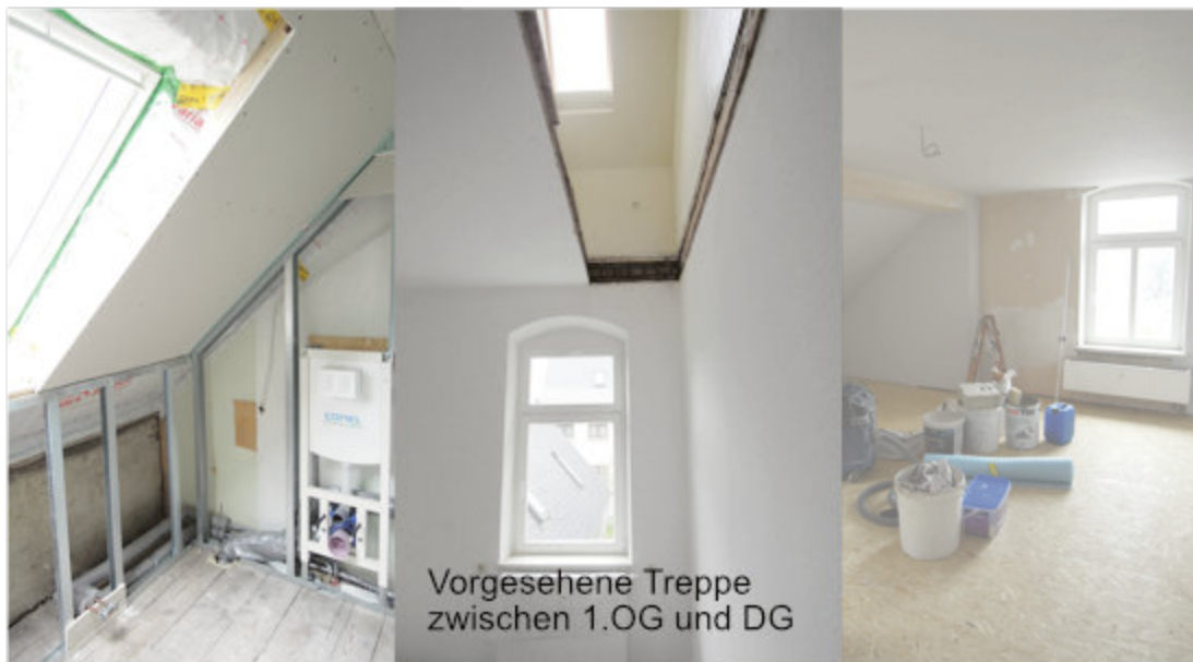
Vorgesehene Treppe zwischen 1.OG und DG

In der Zeit vom 10.08. bis 26.08.2020 ist das Pfarramt geschlossen. Dringende Anfragen bitte auf dem Anrufbeantworter (037342 8290) hinterlassen. Er wird drei Mal in der Woche abgehört.