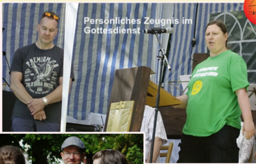
Persönliches Zeugnis im Gottesdienst