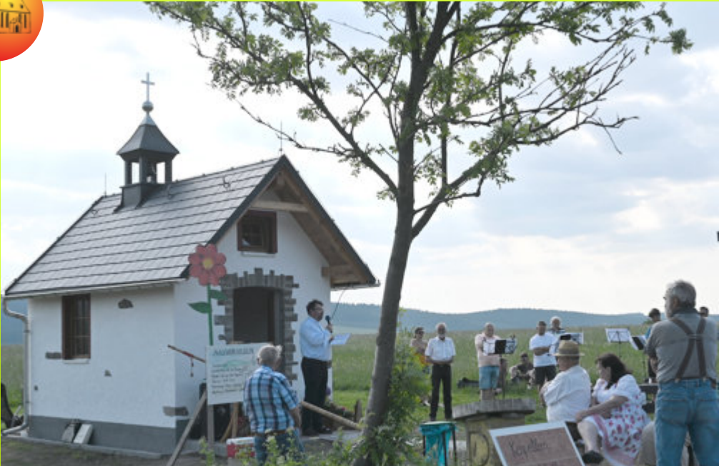
Einweihung der Wanderkapelle in Kretscham